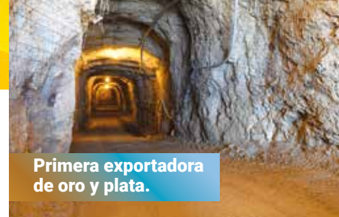
Primera exportadora de oro y plata.