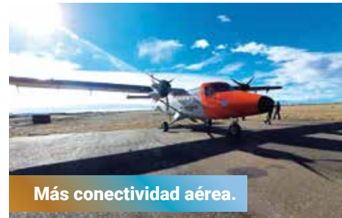
Más conectividad aérea.