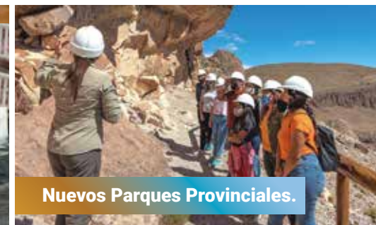
Nuevos Parques Provinciales.