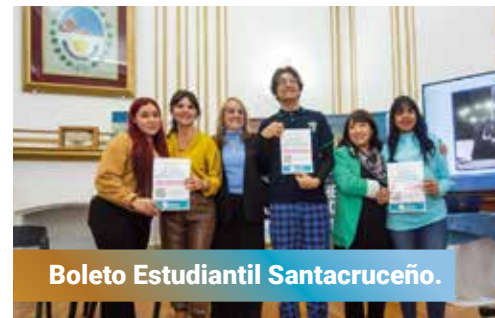
Boleto Estudiantil Santacruceño.

Con trabajo y visión de futuro estamos abriendo oportunidades para que todas las familias e industrias de Santa Cruz puedan crecer y desarrollarse.