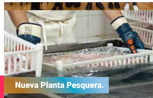
Nueva Planta Pesquera.