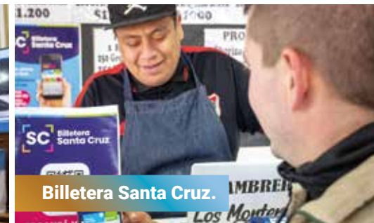
Billetera Santa Cruz.