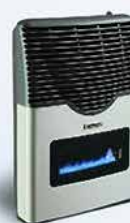
CALEFACCIÓN A GAS Y ELÉCTRICOS