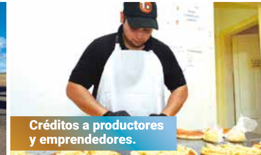
Créditos a emprendedores.