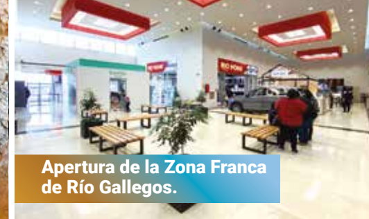
Apertura de la Zona Franca de Río Gallegos.